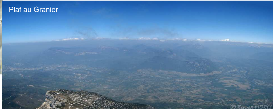
Plaf au Granier