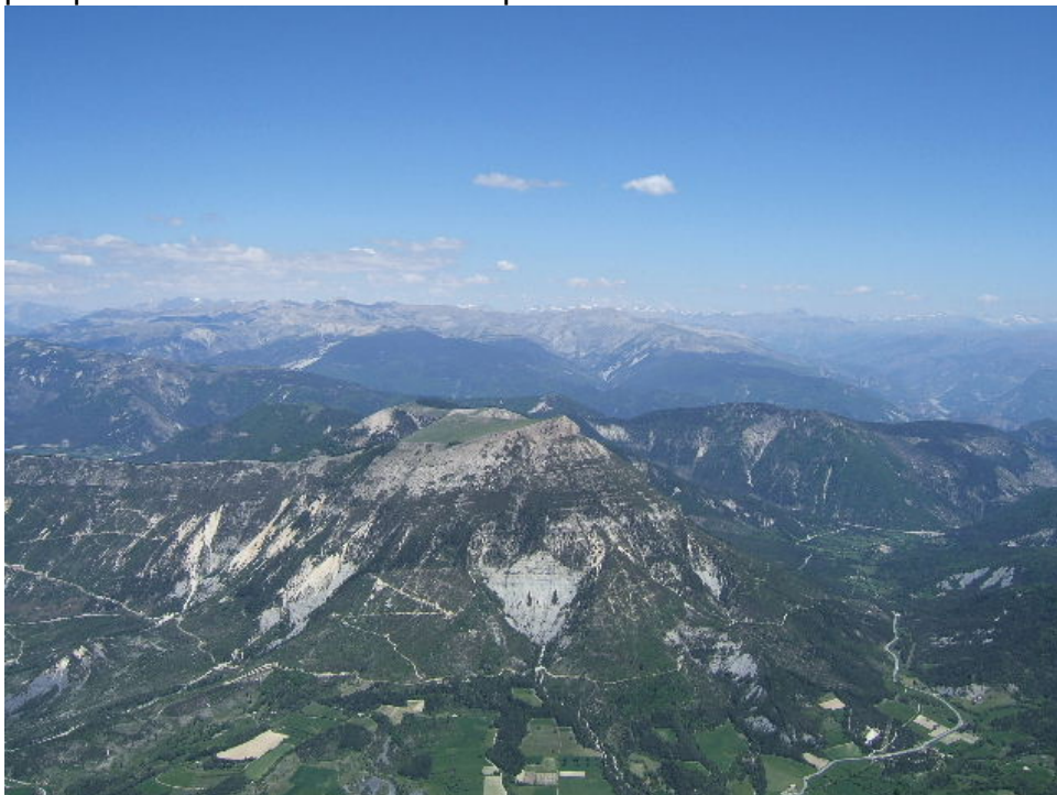
pic de chamatte et crête des serres a gauche ...