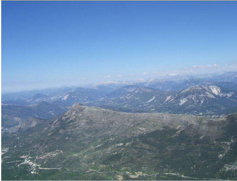
Crémont et en bas a gauche Demandolx ....