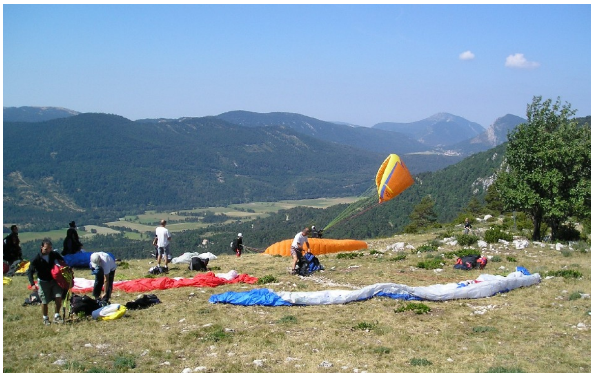
Journée orange ce samedi 1 juillet : les embouteillages au déco de Bleine

Cette journée du samedi 1 juillet 2006 est annoncée très bonne. Beaucoup de membres du club ont projeté un vol au départ du Col de Bleine. Ceux qui ont volé la veille ont décollé très tôt et nous sommes donc déjà plusieurs à être prêts à décoller à 10h pour ne rien rater de cette journée.