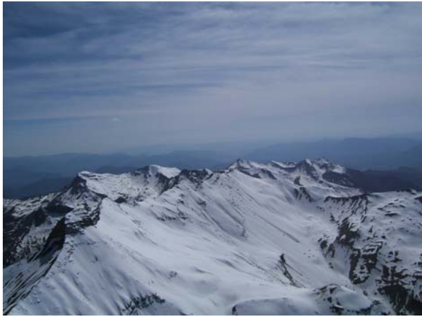
Vue sur le Mourre froid