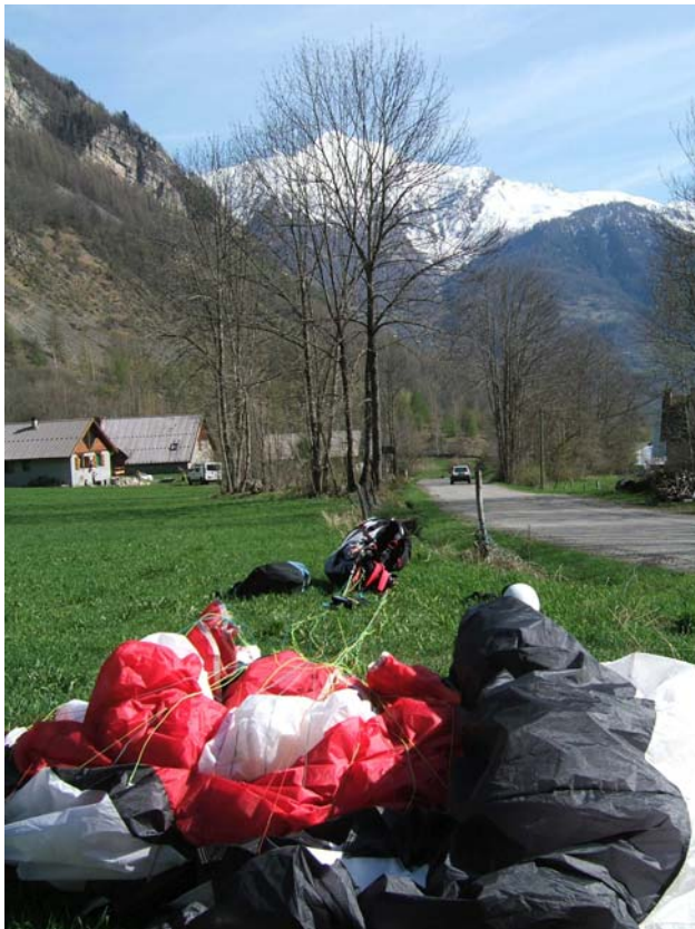
au fond , la grande Autane .

Ce vol plein de rebondissements m'aura laissé des images plein la tête et permis d'en apprendre toujours plus ... J'ai même eu droit à la récup à Gap par les collègues !! royal .