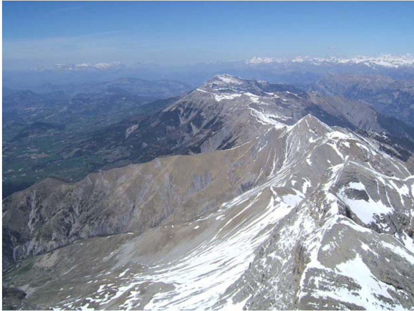
montagne de la Blanche

Ensuite c'est la blanche jusqu'à Dormillouse ; vrai moment de bonheur avec du vario tout le long ; la vue ; les planeurs ...j'adore ce sport !!!