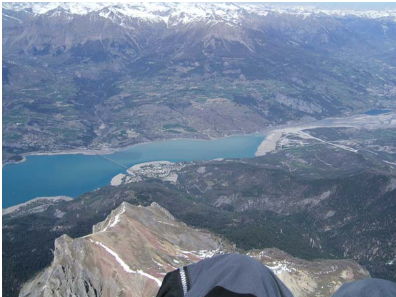
Lac de Serre Ponçon

Durant ma transition ; mon choix se porte sur un éperon que j'espère salulaire .Bingo ; 100 mètres avant ça bipe franchement ..... jusqu'à 3200 m !!