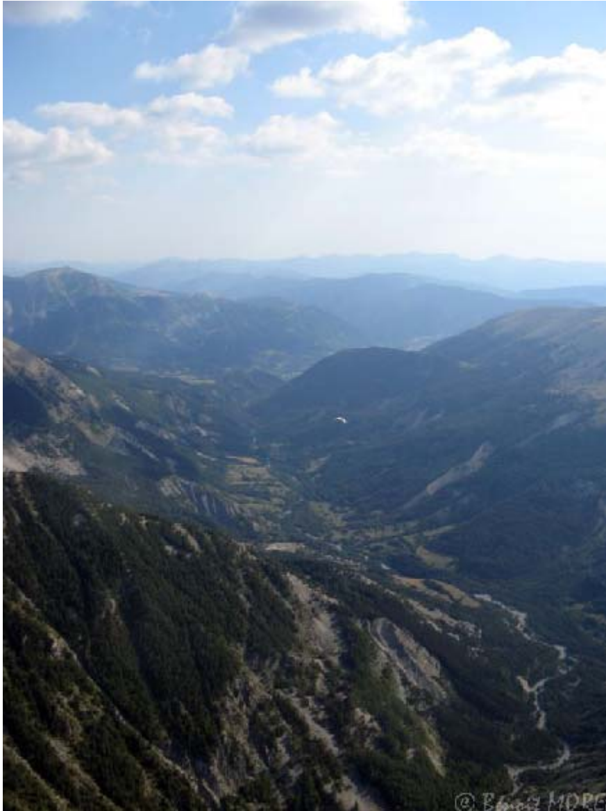
Alain en route sur la montagne de Chamatte