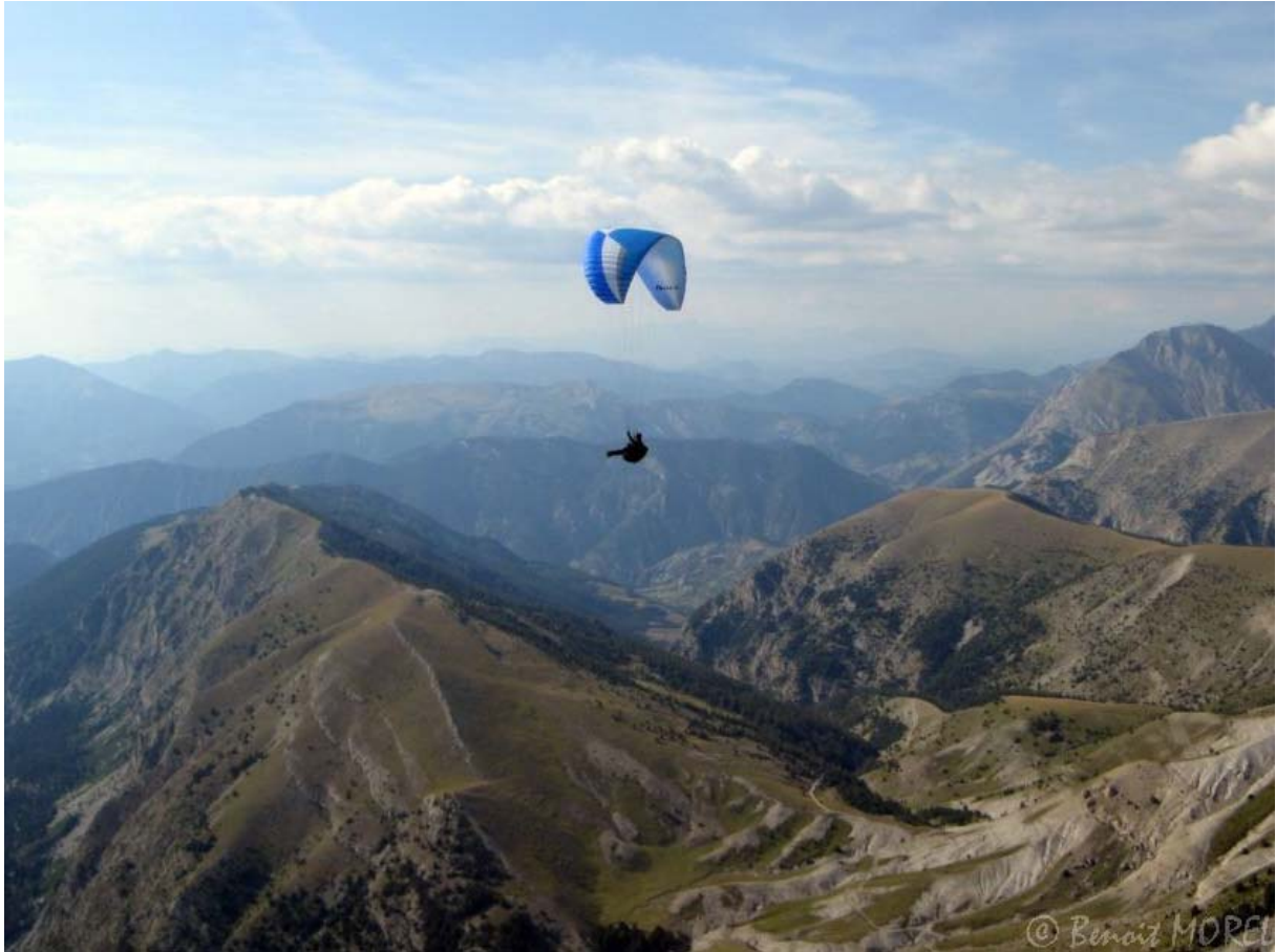
Vers le col de Vachière

Passage du col de Vachière. Le cadre est verdoyant et contraste avec le paysage minéral des hauts sommets.