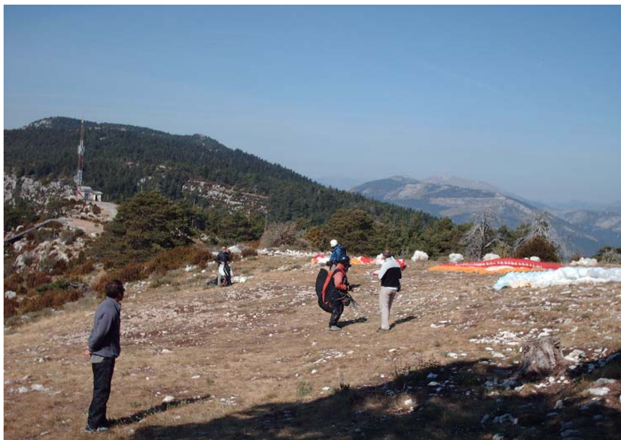
Peu de monde sur le déco de Bleine...bizarre !

Vent météo presque nul à tous les étages, des brises modérées, des beaux petits cumus de partout, des plafonds à 3000 et des thermiques plutôt sympas, parfois péchés mais sans brutalité ni cisaillement. Des conditions de rêve pour un parapentiste du dimanche plutôt habitué aux petites conditions du matin qu'à la grosse baston.