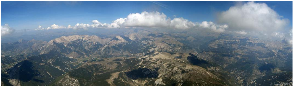
La vallée de Thorame.

Arrive l'épreuve du Cordeil et le passage de la vallée de Thorame. Deux tentatives avortées ces deux dernières années. La 1 ère par manque d'expérience, froid aux mains et le GPS qui s'arrête. La 2 ème pour n'avoir pas fait de plafond. Cette fois-ci, je mets le paquet. Je n'ai pas froid aux mains (ni aux yeux) et je compte bien monter aux barbules. Mais je suis tellement motivé que je fais un tour de trop dans le thermique et la sanction est immédiate. Je vais rentrer dans le nuage. Heureusement, j'avais pris soin de me placer en bordure du nuage et j'avais travaillé le truc avant. Prise de cap sur le GPS et la boussole avant d'entrer dans le brouillard. Je en sors rapidement et sans séquelles émotionnelles, à 3200. Bingo !