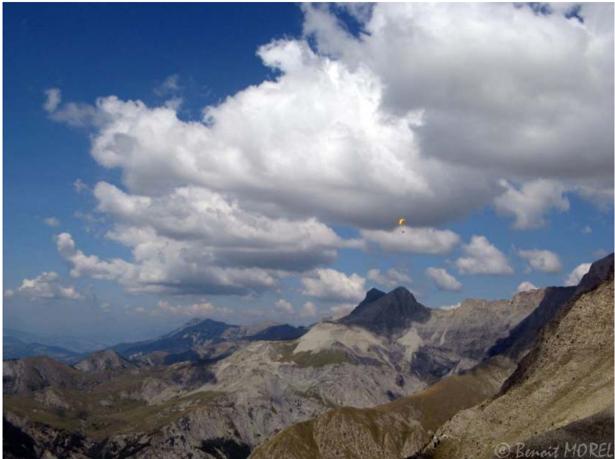
Le pic des têtes et Jean-Paul.

En position de modeste gratte-cailloux, les pieds dans les sapins, la force de l'émotion me porte vers des sommets et je sors à 3000 de cette mauvaise passe. Bon ! Soyons honnête et n'exagérons rien, c'est un peu aussi grâce aux nombreux planeurs qui tournoyaient dans le coin et qui ne manquaient pas de me montrer la voie céleste. Enfin, vous l'aurez compris, l'émotion était à son comble. Face à la tête de l'Estrop, au pic des têtes et au Puy de la Séche, sous mon petit aéronef de chiffons et de ficelles, je ne pouvais m'empêcher d'avoir des pensées quasi-mystiques. On en viendrait presque à ne plus douter de l'existence du créateur de toutes ces merveilles tellement c'est beau ! Ca fait quand même autre chose que de mater ça sur une carte IGN, sur Google Earth ou sur les photos des copains !