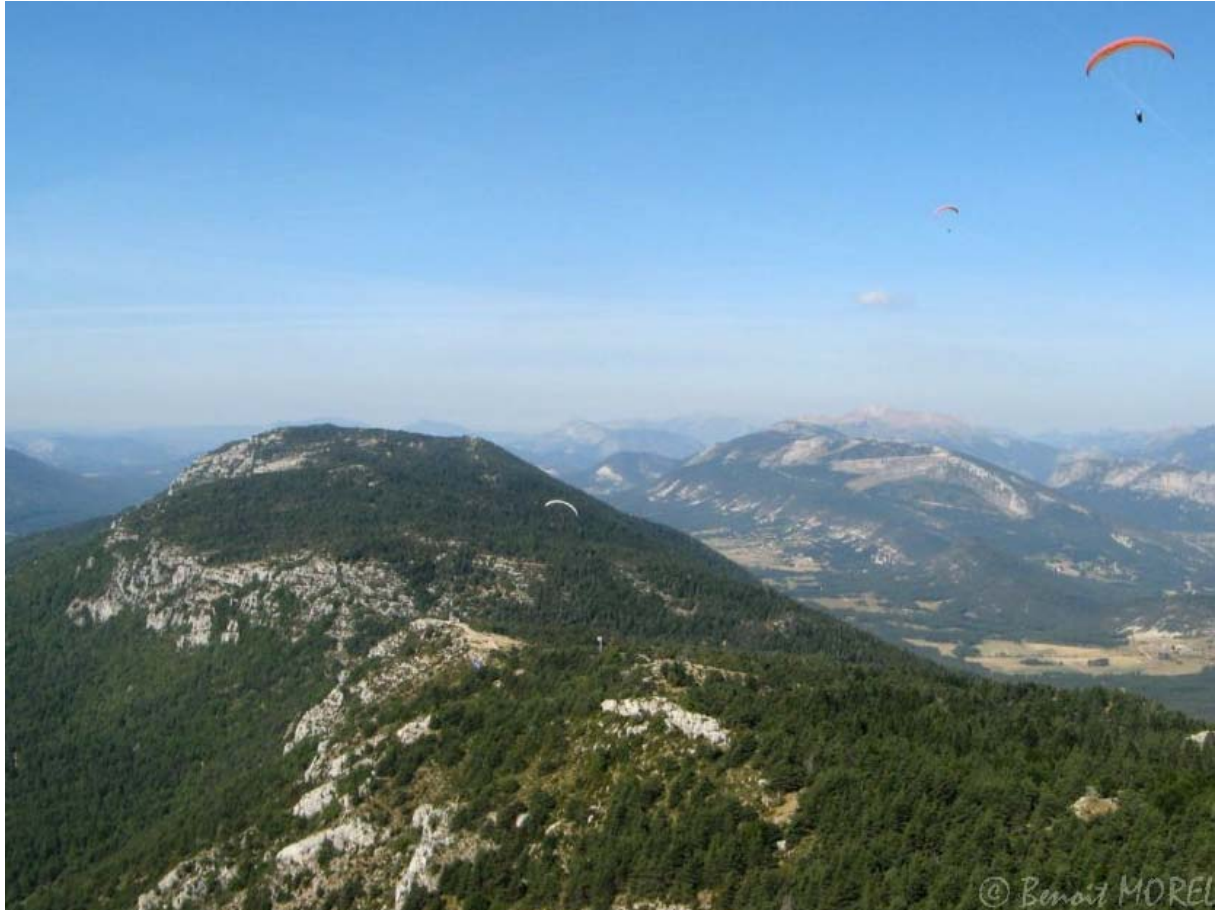
Entre le col de Bleine et le bois brulé.

Je trouve ce début de vol un peu stressant dans ces conditions un peu faiblardes. Je me retrouve à plusieurs reprises plus bas que les autres et j'ai des difficultés à m'extraire du bois brulé mais je m'accroche à tout ce qui monte. Pas question de faire un tas aujourd'hui. J'ai assez donné et le ciel est tellement beau, parsemé de tous ces petits cumus en développement. Ça serait dommage de ne pas en profiter.