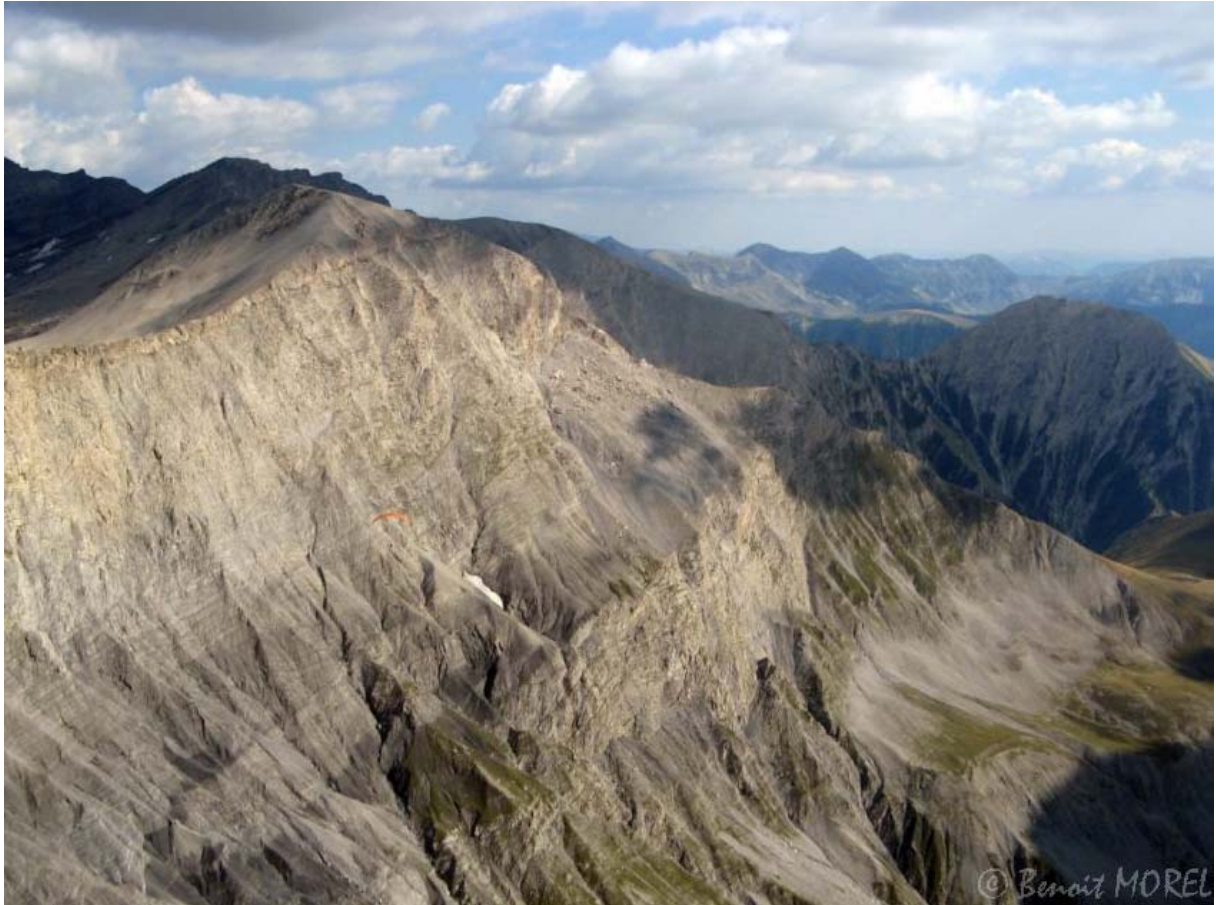
Le puy de la Séche et le Tromas à droite.

3000 au Tromas...Ca monte trop bien de partout. Le retour est facile et rapide.