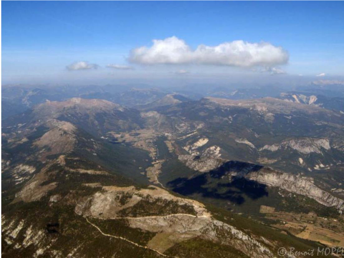
Sur les lattes.