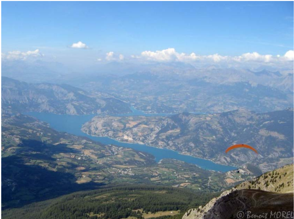
Lac de Serre-Ponçon

J'annonce ma position au groupe et ne manque pas de communiquer ma joie d'être arrivé jusque là : « J'arrive sur Dormillouse. Youpi ! ». Et Alain, de me répondre : « Maintenant tu fais demi-tour et tu longes la crête dans l'autre sens jusqu'au Tromas. Après on verra ». Groupes ! Je n'ai pas un peu l'impression d'avoir la pression là ! Mais où sont-ils ? Je ne vais quand même pas survoler tout ça une 2 ième fois et tout seul ! J'étais à fond moi. J'ai tout donné. La Blanche pour moi, c'était un peu comme le sprint final pour un coureur de fond. J'avais atteint mon objectif.