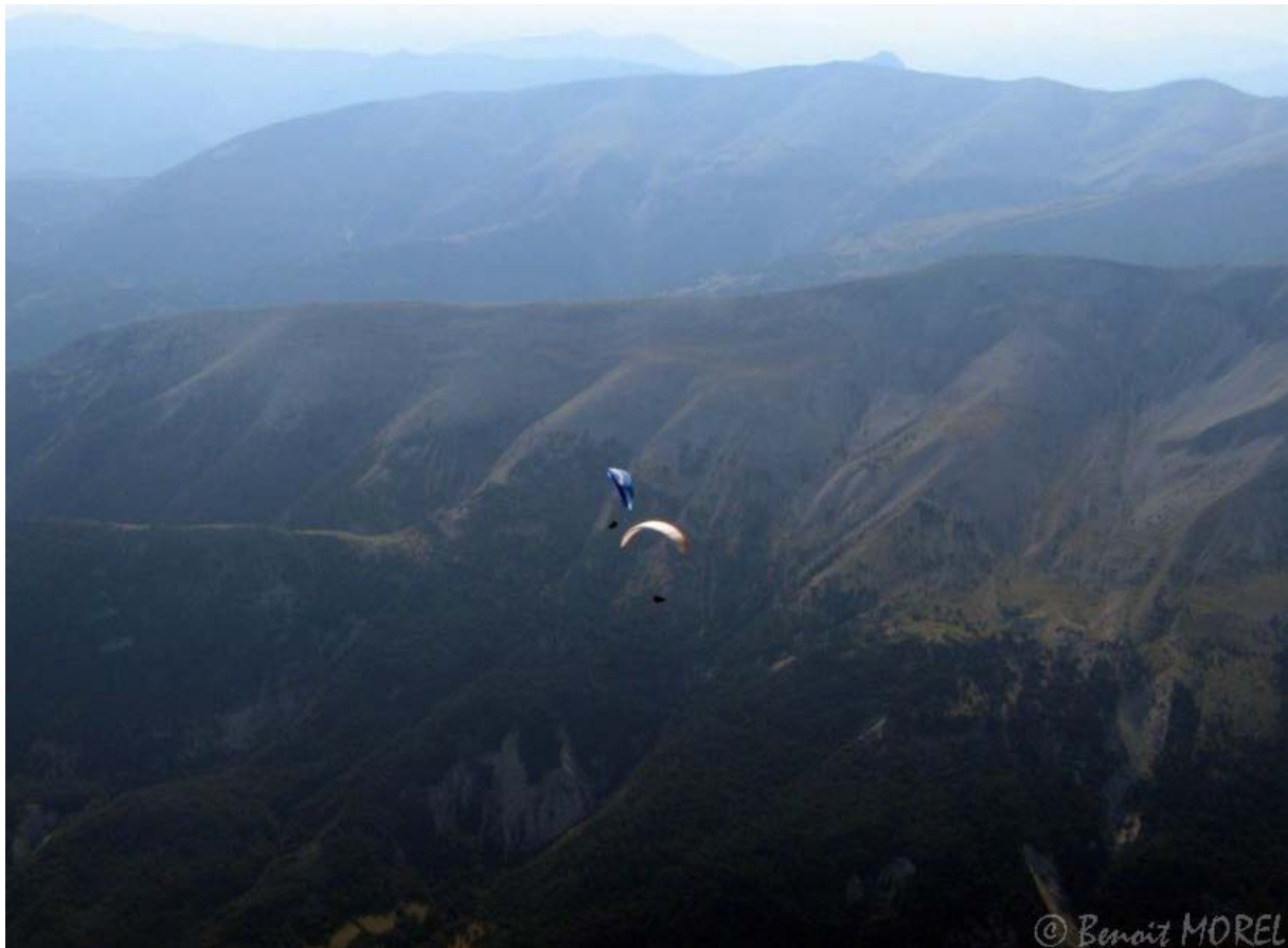
Alain et David dans le thermique de Chamatte

On fait le plein à 3000 sur la montagne de Chamatte dans le plus fort thermique de la journée, 5m/s sur les 1 er tours : ca reste raisonnable.